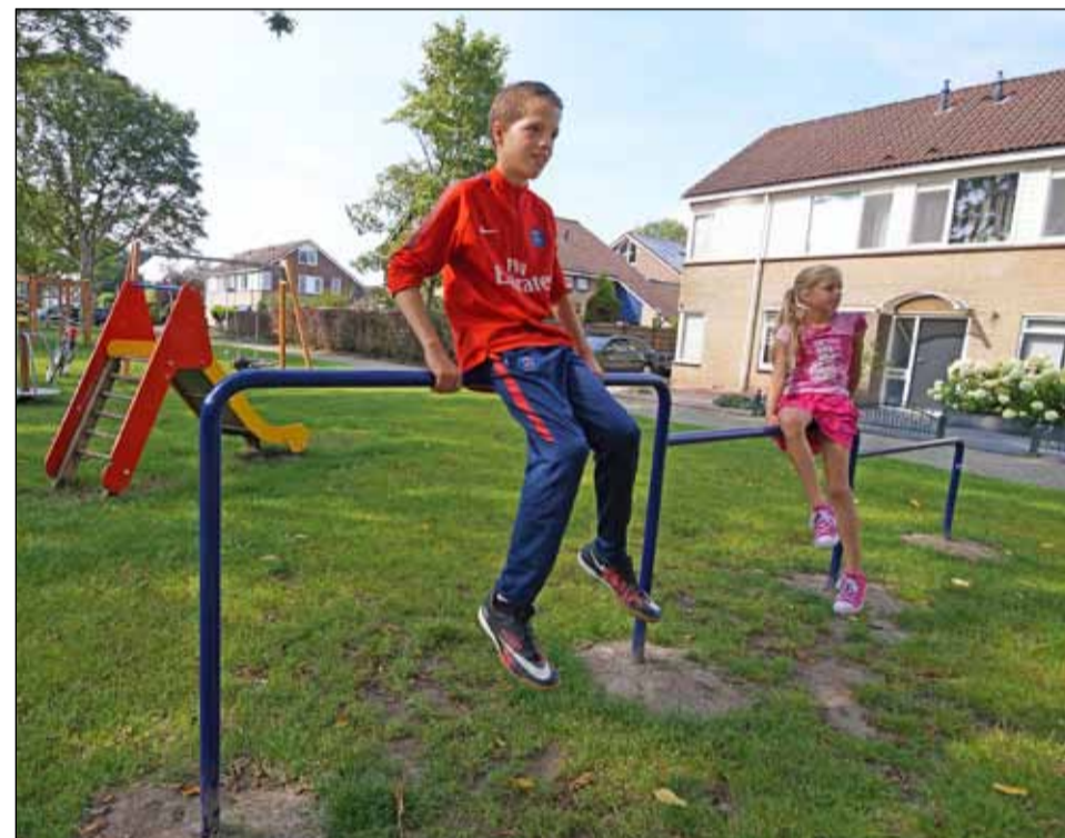
Spelende kinderen op het nieuwe duikelrek op het speelveld aan de Helling.

Na overleg met omwonenden is uiteindelijk besloten welke bomen gekapt zouden worden. Het speelveld is nu een stuk lichter geworden. De houtsnippers zijn vervangen door valtegels en gras en er is een nieuw driedelig duikelrek geplaatst. Binnenkort vervangen wij nog de glijbaan.