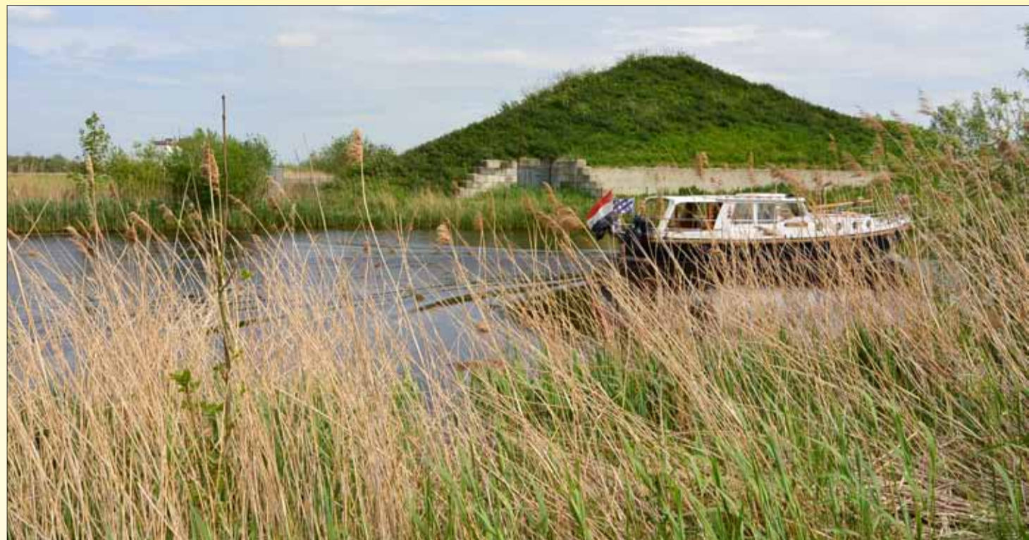
Westkop Tussendiepen

Vervolgens stappen we in een bijzonder vaartuig en vervolgen we onze reis over het water richting het uitkijkpunt op het talud op de Westkop. Daar kan het publiek zelf fantaseren over de nieuwe bestemming voor het gebied naar aanleiding van sciencefiction-verhalen. Na afloop van de reis kunt u de presentatie van de kunstenaars bezoeken in de Sluisfabriek.